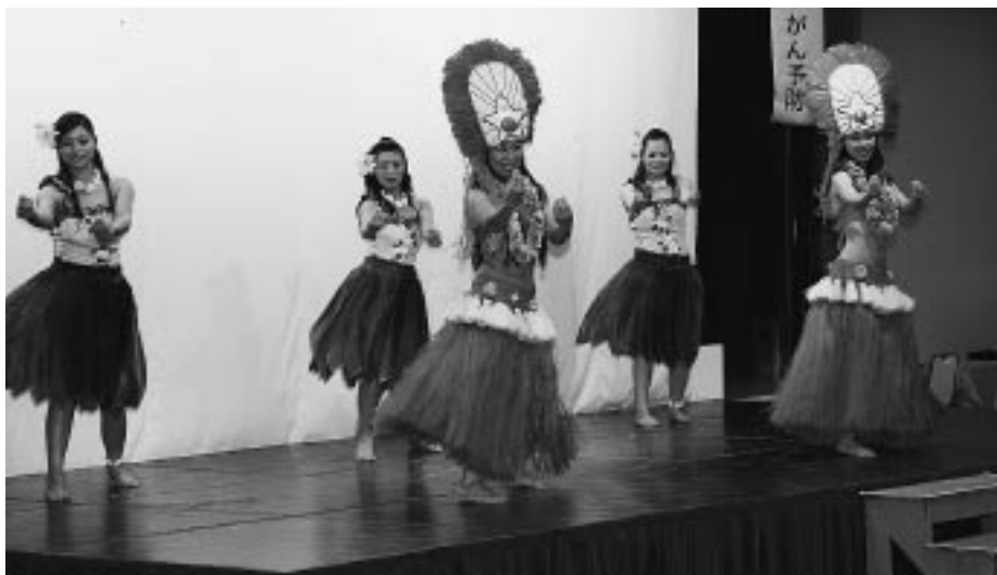
踊る人の笑顔は、観る人の笑顔も引き出していく

常磐ハワイアンセンターが始まってからの人生は、踊りだけで過ごしてきたような感じですね。ちょっと休もうとか、手を抜こうなどと考えもしなかった生活のなかで、あまりにも頑張りすぎてしまったのか、やたら