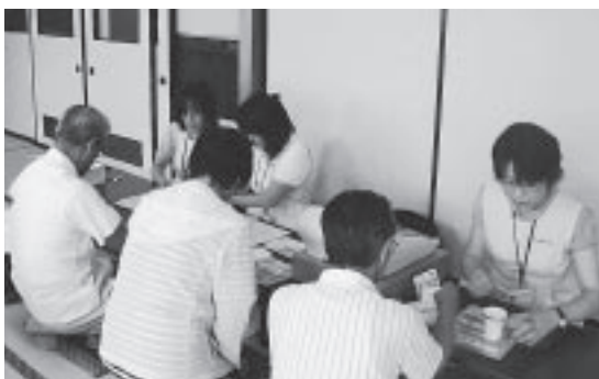
特定健診等による個人負担金の徴収