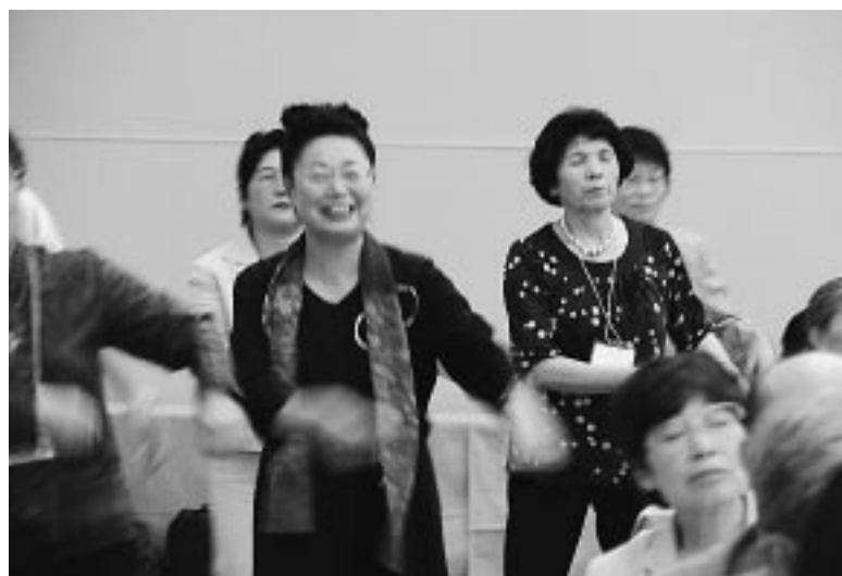
席を立って、一緒に踊りはじめる参加者も

昭和五十一年三月に、常磐ハワイアンセンターが開設十周年を迎えたのを一つの区切りとして、退社して結婚しました。結婚のときの条件も「踊りを続けさせてほしい」という