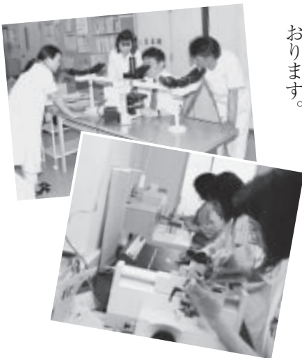
上/主に子宮がん・肺がん検診で採取された細胞を検査する「細胞診」 下/内視鏡検査や手術で採取した組織など、ありとあらゆる検体を扱う「組織診」

病理診断課は、直接受診者に接する事があまりない課ですが、細胞一個一個、組織一片一片の裏側には、生きた一人の人間がいることを肝に銘じて精度の高い検査をすべく、仕事に取り組んでおります。