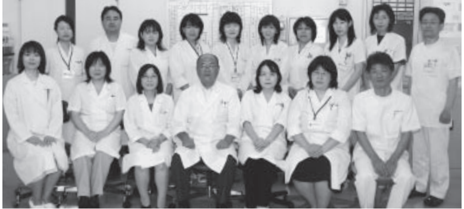
細胞診課と組織診課の統合を機に引っ越ししました。

今回は、細胞診課と組織診課が統合し今年新装開店した病理診断課の紹介です。旧組織診課は、長年、福島医科大学の一室をお借りしていましたが、総合健診センターの西側にある細胞診管理センターの一階に引越してきました。