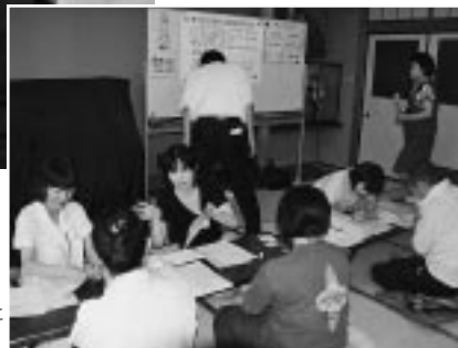
問診をする本会の看護師と 福島市の保健師の方々